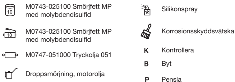
Bild 2. Teckenförklaring