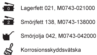
Bild 3. Teckenförklaringar