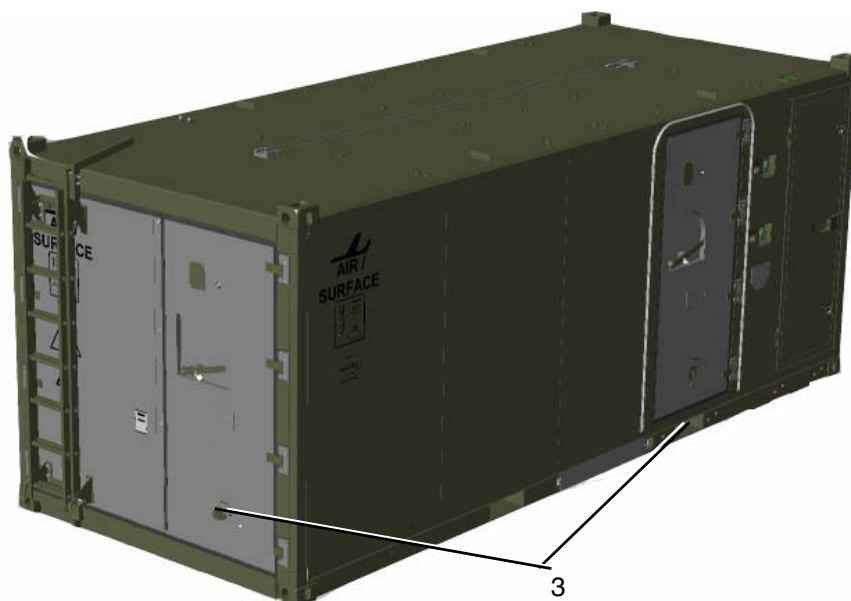
Bild 2. Utvändig vy, bakre gavel/höger sida